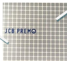
専用封筒イメージ

「ご利用の手引き」を添えてお渡しいたします。 封筒の種類は今後追加予定がございますので、改めてご案内いたします。